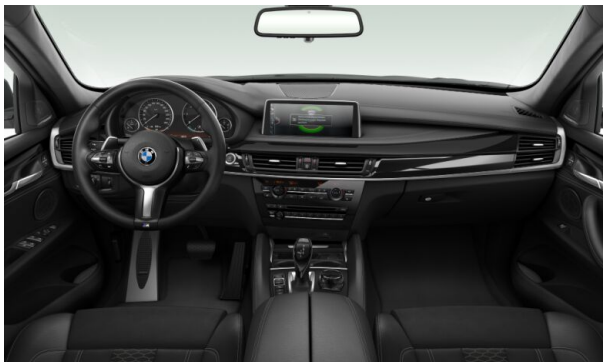
Innenraum / Armatur