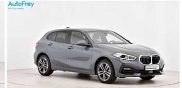
AutoFrey - Salzburg - www.autofrey.at