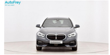
AutoFrey - Salzburg - www.autofrey.at