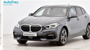
AutoFrey - Salzburg - www.autofrey.at