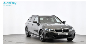
AutoFrey - Hallwang - www.autofrey.at

BMW PREMIUM SELECTION. GEBRAUCHTE AUTOMOBILE. MIN. 12 MONATE BMW PREMIUM SELECTION GARANTIE 360 GRAD CHECK WARTUNGSPREIS FÜR 6 MONATE / 10.000 KM LEASING UND FINANZIERUNG GEPRÜFTE FAHRZEUGHISTORIE BMW PREMIUM SELECTION