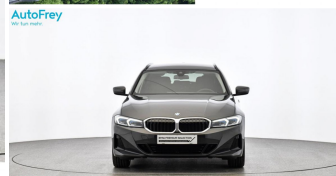
AutoFrey - Hallwang - www.autofrey.at