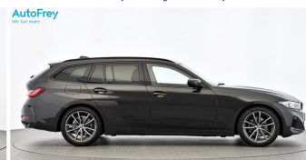
AutoFrey - Hallwang - www.autofrey.at