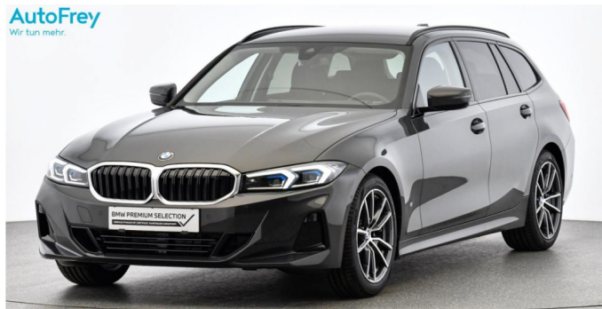
AutoFrey - Hallwang - www.autofrey.at