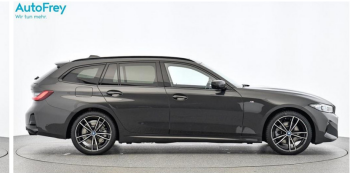
AutoFrey - Hallwang - www.autofrey.at