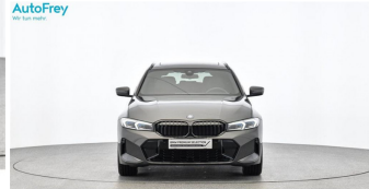
AutoFrey - Hallwang - www.autofrey.at