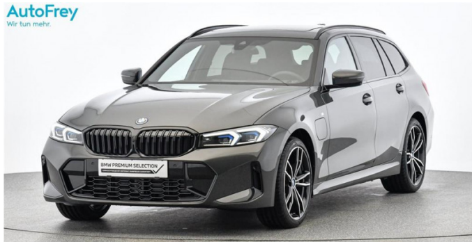
AutoFrey - Hallwang - www.autofrey.at