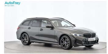
AutoFrey - Hallwang - www.autofrey.at