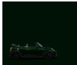
Rebel Green 4

Für jeden Trim stehen einzigartige Lackfarben zur Wahl. Die Außenspiegelkappen sind in Wagenfarbe oder mit farblich korrespondierenden Bonnet Stripes in den Kontrasttönen Aspen White, Melting Silver oder Jet Black verfügbar. Falls es doch mal regnen sollte, stehen Ihnen zwei verschiedene Verdeckstoffe zur Verfügung.