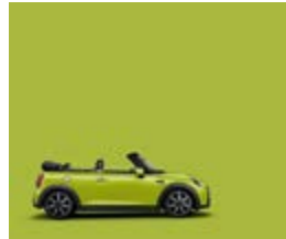
Zesty Yellow 2