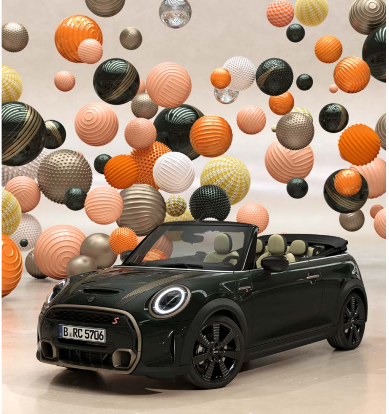
Abbildung zeigt MINI Resolute Edition. Mehr Informationen zu dieser Edition erhalten Sie auf mini.at .