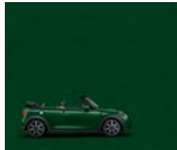
British Racing Green