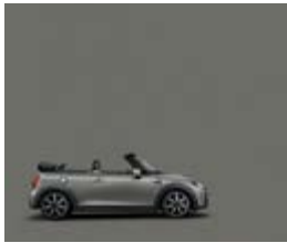
Serienfarbe Moonwalk Grey