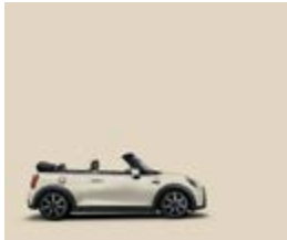
Pepper White 2