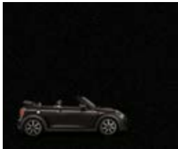
Midnight Black II