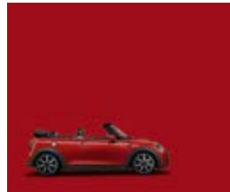
Chili Red 2