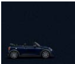
Sonderfarbe MINI Yours Enigmatic Black