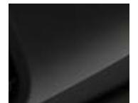
Hazy Grey 3

Die Colour Lines definieren die Farbgebung von Türaromauflege und Knie Rolls. Sie richten sich dabei immer nach der Farbe der Sitze und verfeinern den ausgewählten Stil bis ins Detail.