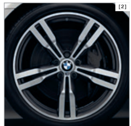
Abbildung zeigt BMW 750Li xDrive* mit M Sportpaket in der optionalen Außenfarbe Mineralweiß metallic, 20" M Leichtmetallräder Doppelspeiche 648 M Bicolor Orbitgrau mit Mischbereifung und Hochglanz Shadow Line

Detaillierte Informationen und Abbildungen zu den verfügbaren Lackierungen, Polsterungen, Interieurleisten und Rädern finden Sie im Katalog.