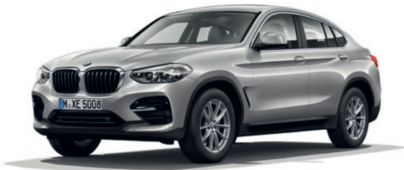
Abbildung zeigt BMW X4 xDrive20d als Modell Advantage in der optionalen Außenfarbe Glaciersilber metallic, 18" Leichtmetallräder Doppelspeiche 618.

Das Modell Advantage* bildet die Basis für alle nachfolgenden Modelle.