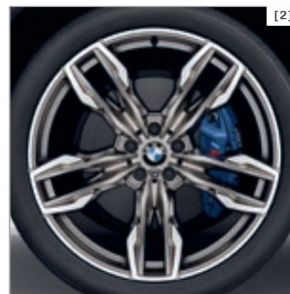
Abbildung zeigt BMW X4 M40d in der optionalen Außenfarbe Black Sapphire metallic, optionale 21" M Leichtmetallräder Doppelspeiche 718 M mit Mischbereifung.

* Detaillierte Informationen und Abbildungen zu den verfügbaren Lackierungen, Polsterungen, Interieurleisten und Rädern finden Sie im Katalog.