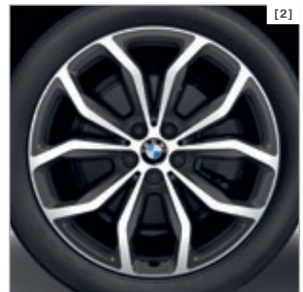
Abbildung zeigt BMW X4 xDrive20d als Modell xLine in der Außenfarbe Phytonicblau metallic, optionale 20" Leichtmetallräder Y-Speiche 695 mit Mischbereifung.

* Detaillierte Informationen und Abbildungen zu den verfügbaren Lackierungen, Polsterungen, Interieurleisten und Rädern finden Sie im Katalog.