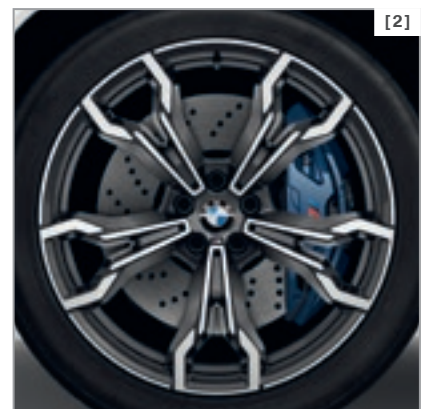
Abbildung zeigt BMW X4 M in der Außenfarbe Alpinweiß, optionale 20" M Leichtmetallräder V-Speiche 765 M mit Mischbereifung.

* Detaillierte Informationen und Abbildungen zu den verfügbaren Lackierungen, Polsterungen, Interieurleisten und Rädern finden Sie im Katalog.