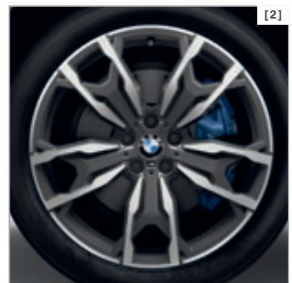
Abbildung zeigt BMW X4 xDrive30i als Modell M Sport X in der Außenfarbe Sophistograu metallic, optionale 20" M Leichtmetallräder Doppelspeiche 787 M mit Mischbereifung.

* Detaillierte Informationen und Abbildungen zu den verfügbaren Lackierungen, Polsterungen, Interieurleisten und Rädern finden Sie im Katalog.