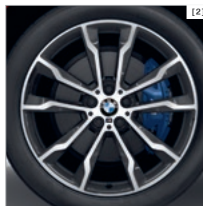
Abbildung zeigt BMW X4 xDrive30i als Modell M Sport in der Außenfarbe Flamencorot Brillanteffekt metallic, optionale 20" M Leichtmetallräder Doppelspeiche 699 M mit Mischbereifung.

* Detaillierte Informationen und Abbildungen zu den verfügbaren Lackierungen, Polsterungen, Interieurleisten und Rädern finden Sie im Katalog.