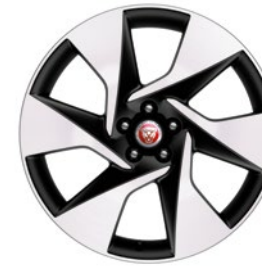
20" MIT 6 SPEICHEN GLOSS DARK GREY CONTRAST DIAMOND TURNED (STYLE 6007)