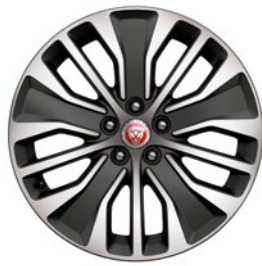
18"/19" MIT 5 DOPPELSPEICHEN GLOSS DARK GREY CONTRAST DIAMOND TURNED (STYLE 5055)