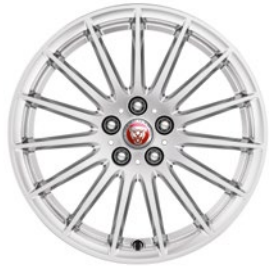
18" MIT 15 SPEICHEN GLOSS SPARKLE SILVER (STYLE 1022)