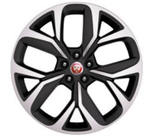
20" MIT 5 SPEICHEN GLOSS DARK GREY CONTRAST DIAMOND TURNED (STYLE 5068)