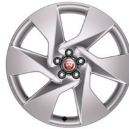
20" MIT 6 SPEICHEN GLOSS SPARKLE SILVER (STYLE 6007)