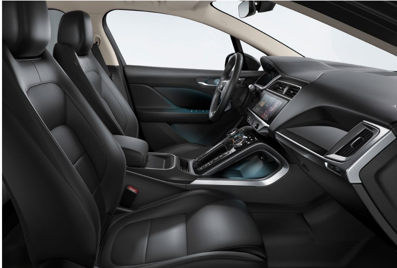
ABGEBILDETES FAHRZEUG: I-PACE AUSTRIA EDITION MIT SONDERAUSSTATTUNG