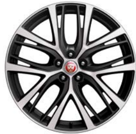
20" MIT 5 DOPPELSPEICHEN, TECHNICAL GREY, DIAMOND TURNED (STYLE 5070)