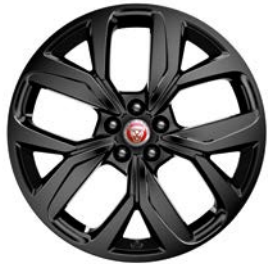
20" MIT 5 SPEICHEN, GLOSS BLACK (STYLE 5068)