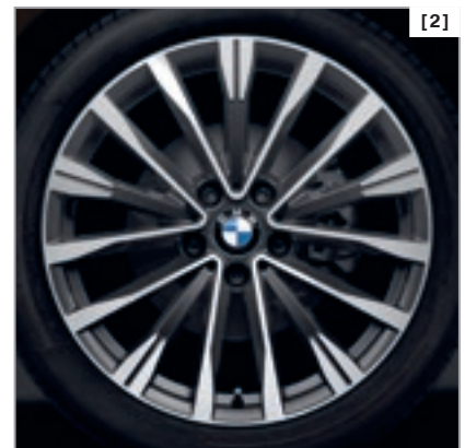
Abbildung zeigt BMW 340i, Modell Sport Line, Mineralgrau metallic, Exterieurumfänge in Aluminium satiniert, M Sportbremse, PDC vorn und hinten, 19" Leichtmetallräder Doppelspeiche 397.

* Detaillierte Informationen und Abbildungen zu den verfügbaren Lackierungen, Polsterungen, Interieurleisten und Rädern finden Sie im Katalog.