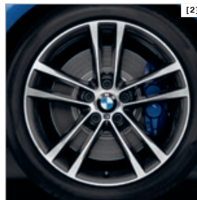
Abbildung zeigt BMW 340i, Modell M Sport, Estoril Blau metallic, M Sportbremse, PDC vorn und hinten, 19" Leichtmetallräder 598 M.

* Detaillierte Informationen und Abbildungen zu den verfügbaren Lackierungen, Polsterungen, Interieurleisten und Rädern finden Sie im Katalog.