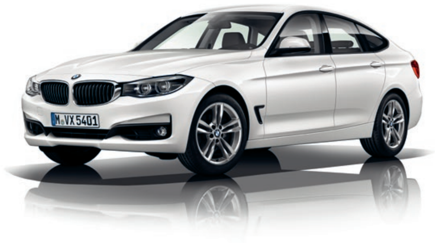
Abbildung zeigt BMW 320d, Modell Advantage, Alpinweiß uni, 18" Leichtmetallräder 658.

Das Modell Advantage* bildet die Basis für alle nachfolgenden Modelle.