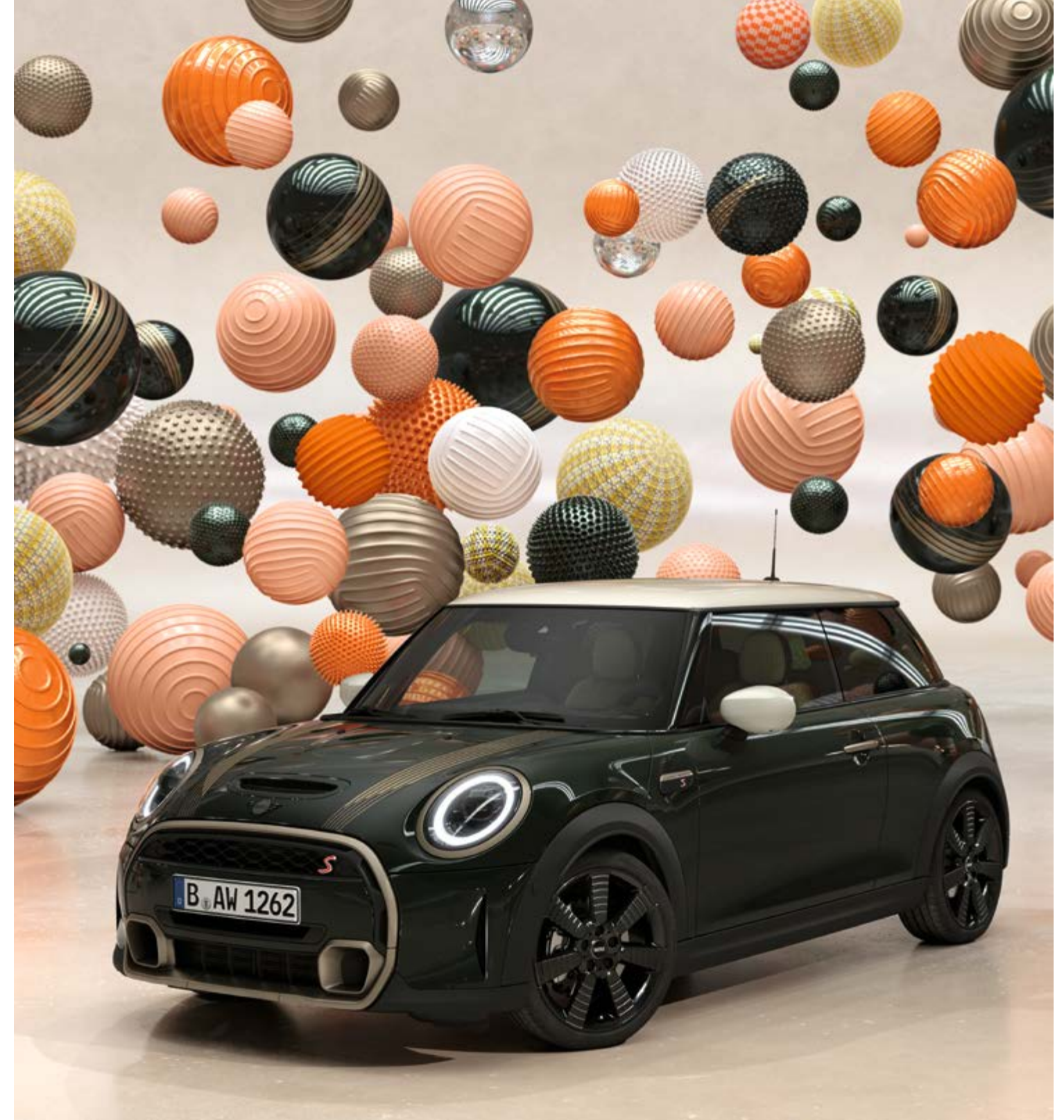
Abbildung zeigt MINI Resolute Edition. Mehr Informationen zu dieser Edition erhalten Sie auf mini.at .

Volle Kraft voraus: Der 2,0l 4-Zylinder-Benzinmotor bietet mit 131 kW*/178 PS hohe Leistung in jeder Lage. Dazu passt der sportliche Auftritt mit den Lufteinlässen im Stoßfänger und in der Motorhaube, der Heckschürze mit Diffusoreinsatz, den mit-tigen Doppelauspuffendrohren sowie dem modellspezifischen Heckspoiler.