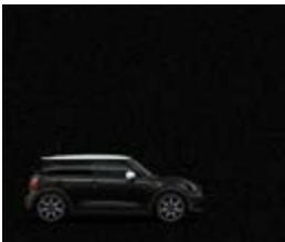
Midnight Black II