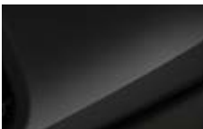
Hazy Grey 3