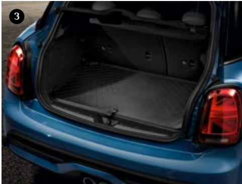
1 Dachbox 320, schwarz. 2 Allwetter-Fußmatten. 3 Gepäckraum-Formmatte, essential-schwarz