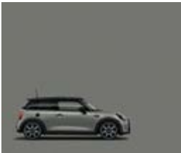
Serienfarbe Melting Silver III