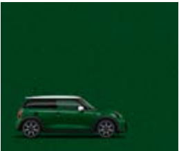
British Racing Green IV