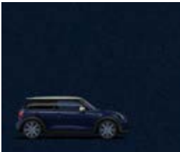
Sonderfarbe MINI Yours Enigmatic Black