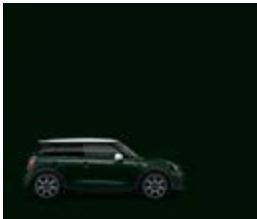
Rebel Green 4